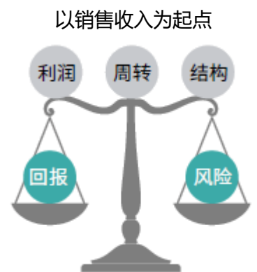
公司财务分析的核心思路